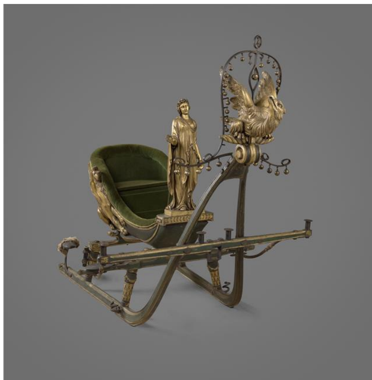
Traîneau dit de Joséphine

La collection des traîneaux d'apparat du Château de Compiègne est l'une des plus belles d'Europe. Quelques pièces incroyables ont été restaurées pour être présentées à l'occasion de cette exposition en galeries de Bal. La grande richesse décorative et la variété de styles de ces objets vous attendent au Château de Compiègne !