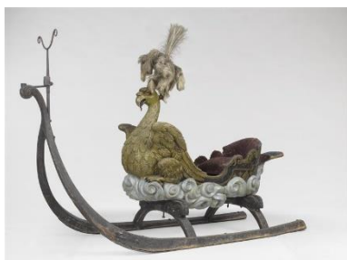
Traîneau d'apparat en forme d'aigle