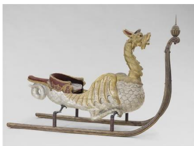
Traîneau d'apparat en forme de dragon,