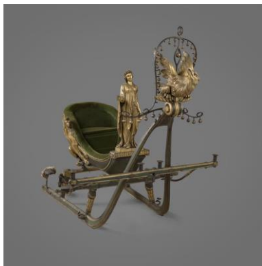
Traîneau dit de Joséphine

Autorisation de reproduction uniquement dans le cadre de la promotion de cette exposition. Toutes les images numériques fournies devront être détruites après leur utilisation.